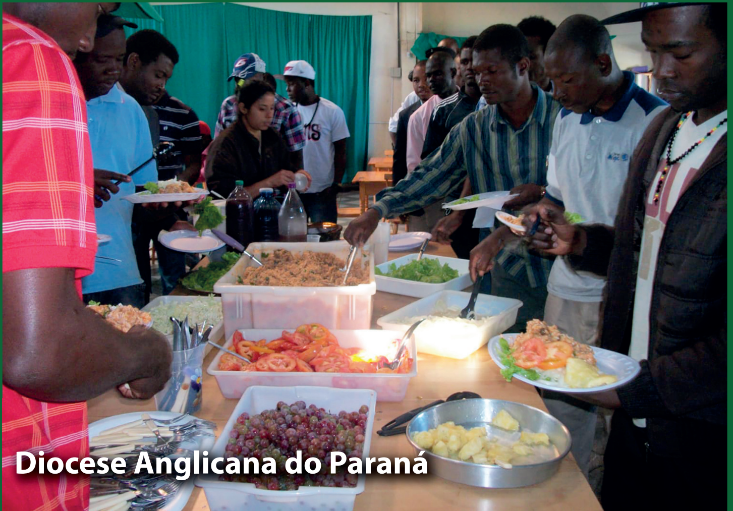
Diocese Anglicana do Paraná